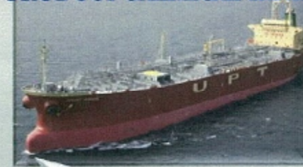
ケミカル・タンカー(化学製品運搬船) PRODUCT CHEMICAL TANKER

ベンゼンやアルコール、硫酸、大豆油などの液体化学品を運ぶ船で、小さなタンクをたくさん持っています。