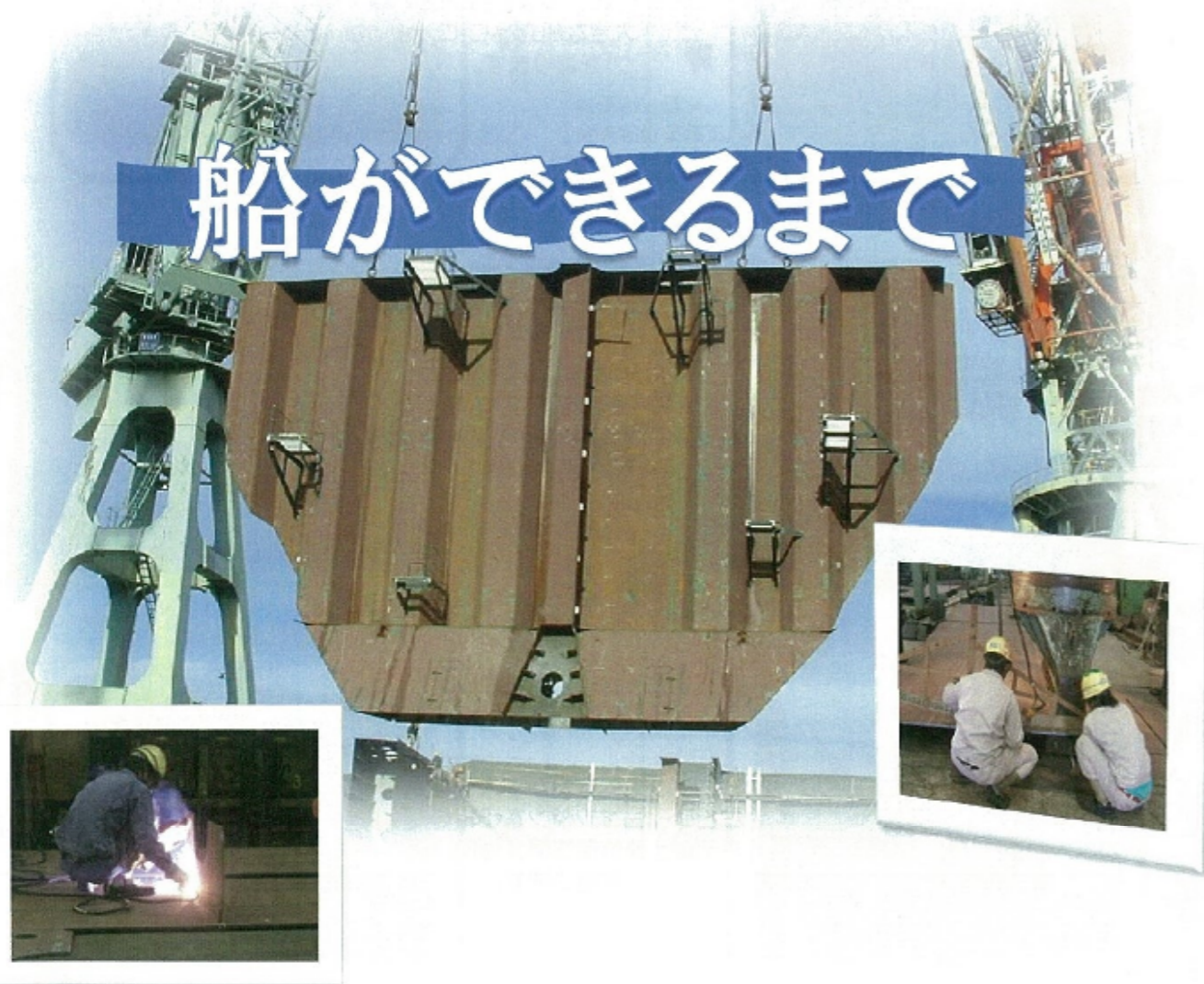
バルクキャリア(バラ積み船)